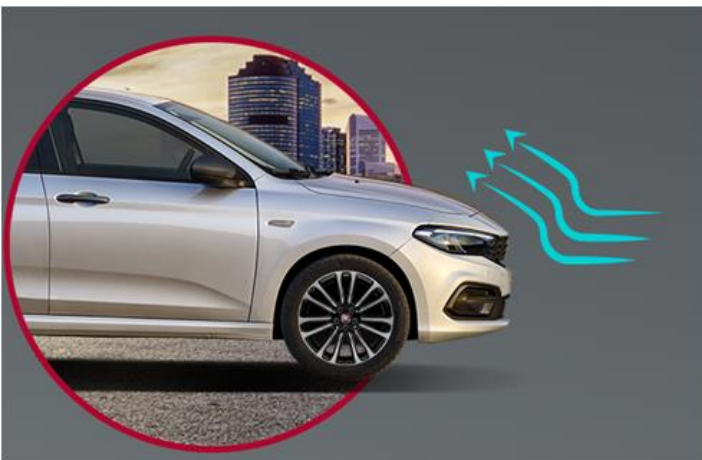
Активна заслонка решітки радіатора