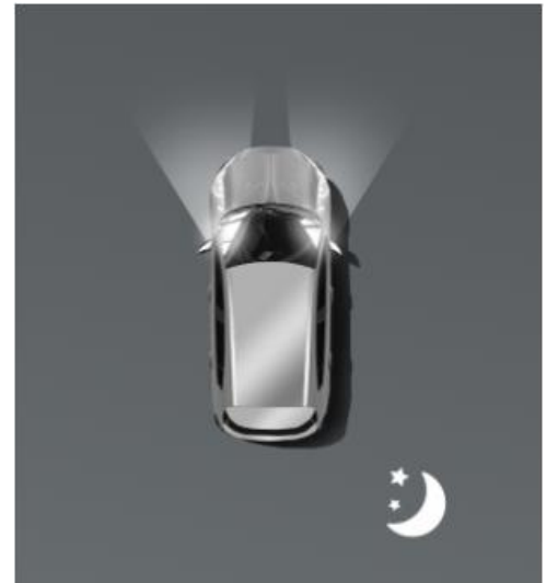
Автоматичне дальнє світло