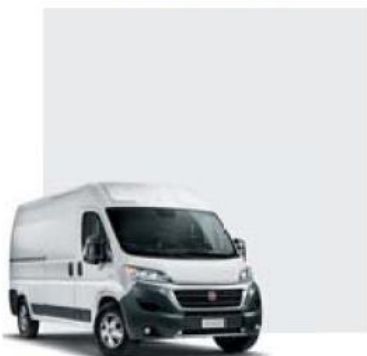
549 Bianco Ducato