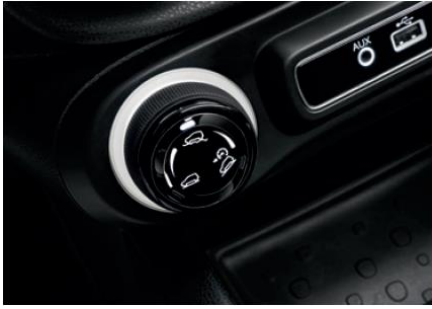
Drive Mood Selector (селектор вибору режиму водіння)