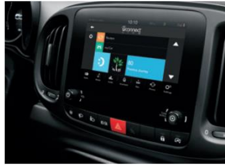
7" кольоровий сенсорний екран, радіо,