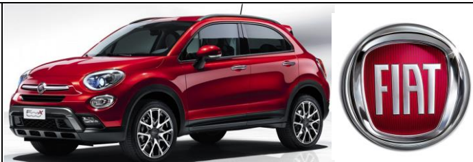
Fiat 500 X (cross) позашляхова версія

ООО«Захід Авто-М» м. Мукачєво, вул. Автомобілістів 3-Г тел.. (03131)3-18-50 www.fiat-ukraine.com